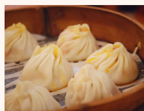
下ノ衛兵交代式 左ノ小籠包(イメージ)