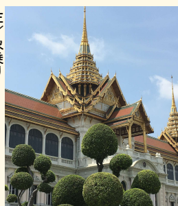
上/王宮 左/アユタヤ遺跡